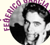
FEDERICO GARCÍA LORCA

1896-1981 Ossi di seppia (1925) p. 136 Satura (1971) p. 170