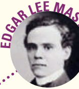
EDGAR LEE MASTERS

1888-1970 Il porto sepolto (1916) p. 104 Sentimento del tempo (1933) p. 122