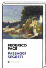
"PASSAGGI SEGRETI" di Federico Pace Laterza, pp. 208, € 15