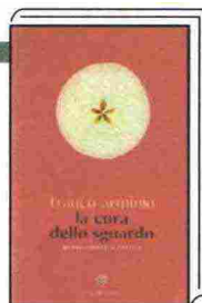
"LA CURA DELLO SGUARDO" di Franco Arminio Bompiani, pp. 208, € 16