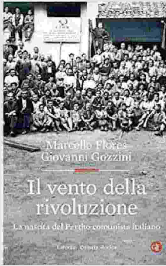
Marcello Flores-Giovanni Gozzini Il vento della rivoluzione LATERZA