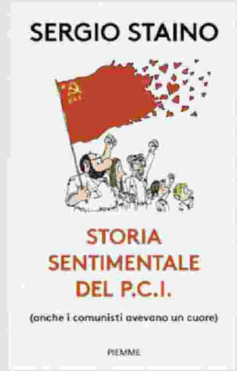
Sergio Staino Storia sentimentale del Pci PIEMME